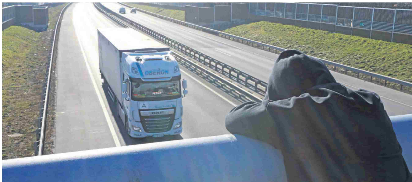
Samomorov je še vedno več na vzhodu države, vendar zemljevida ne moremo več izrazito dati na pol.